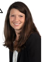
GF C. Maislinger

Bitte alle Leichtverpackungen sauber und restentleert in die Gelbe Tonne/den Gelben Sack werfen. Danke.