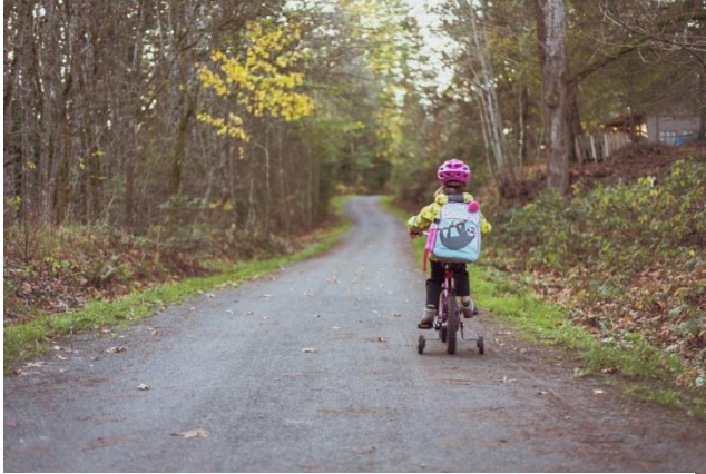
Radeln auch im Herbst/Winter

Rund 2.000 TeilnehmerInnen waren von Mai bis September mit dem Rad für "Salzburg radelt" unterwegs. Dank dieses Engagements wurden viele Radkilometer gesammelt und damit CO 2 eingespart. In der Region Flachgau-Nord allein wurden 97.262,5 km geradelt. Wir gratulieren recht