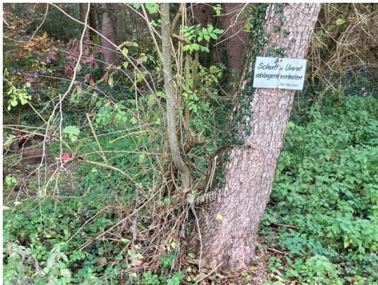
Private Initiative gegen Müll im Wald

Die Studien haben eines gemeinsam: den meisten Müll in der Umwelt macht der Verpackungsmüll aus. Dabei handelt es sich um Getränkedosen, PET-Flaschen oder Take-Away-Verpackungen u.ä.